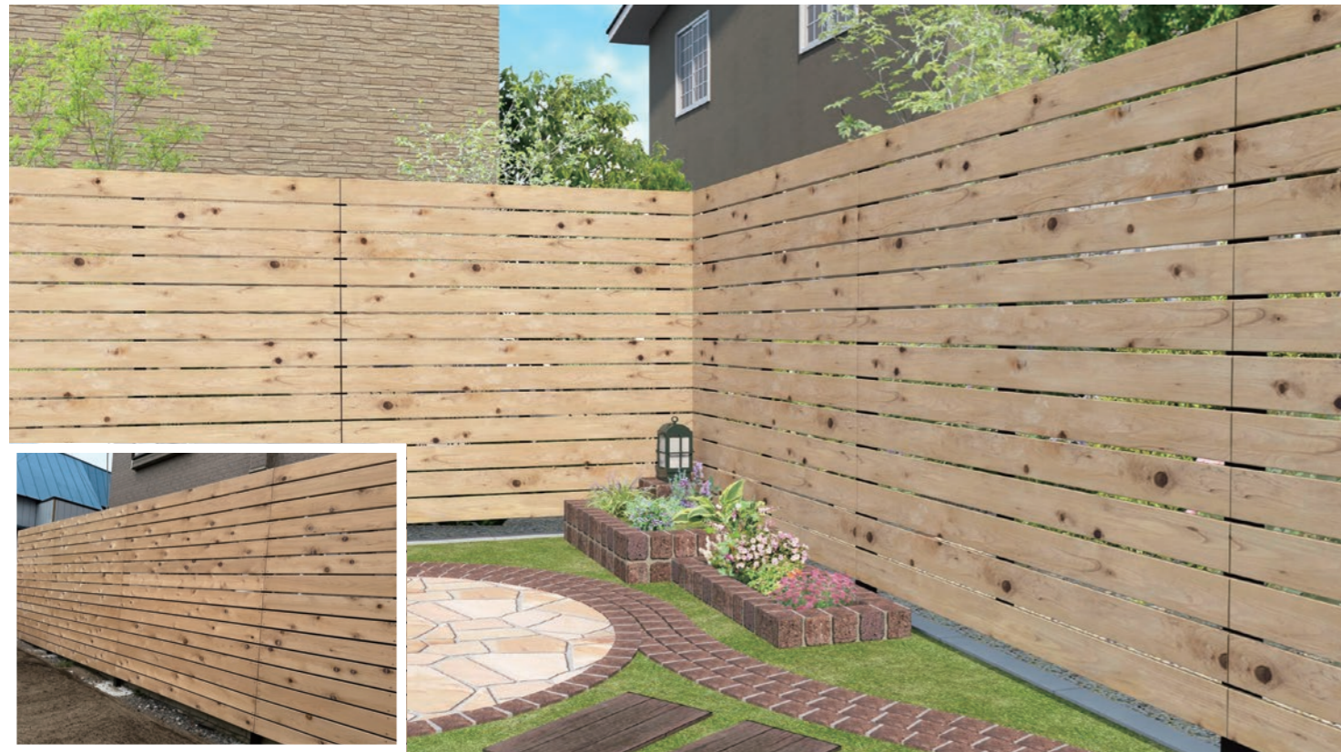
ヒバセレクトフェンス(柱1.8mピッチ仕様) T-18 13段(すき間10mm)